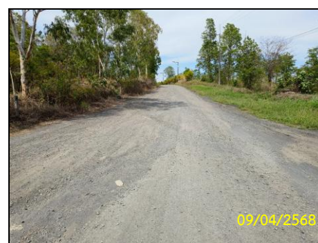
รูปที่ 1-2 เส้นทางคมนาคมเข้าสู่พื้นที่โครงการ