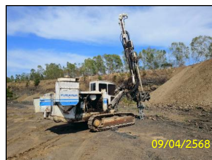
ภาพที่ 1-1 บริเวณหน้าเหมืองของโครงการ